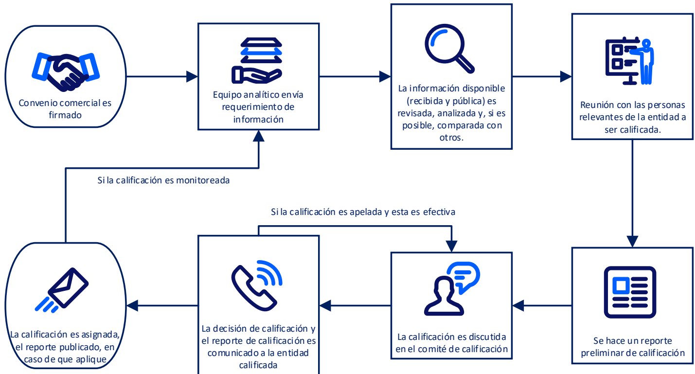
FIGURA 6 Representación gráfica del proceso de calificación

El proceso de calificación se divide en dos etapas diferentes: el proceso de calificación inicial y el proceso de supervisión de la calificación. En general, el proceso para ambas etapas se describe en el siguiente gráfico.